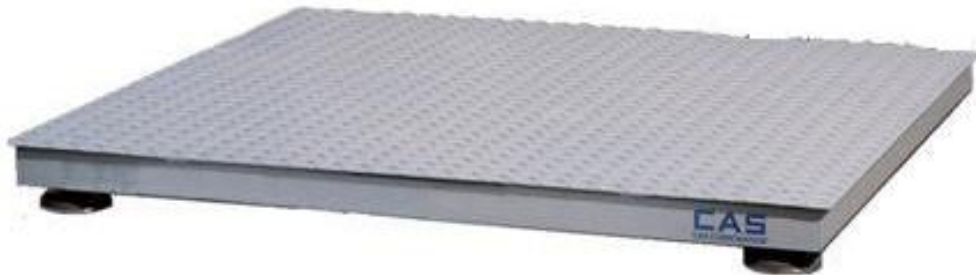
Рисунок 1 – Общий вид весов HFS

Общий вид ГПУ весов HFS представлен на рисунке 1, весов R – на рисунке 2. Общий вид весоизмерительных индикаторов представлен на рисунке 3.