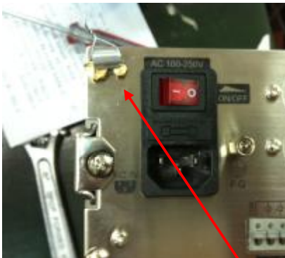
CI-501, CI-502, CI-503, CI-505, CI-507