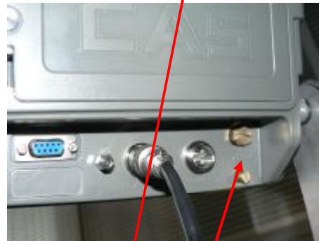
CI-200A, CI-200S/SC, CI-201A, CI-201S/SC