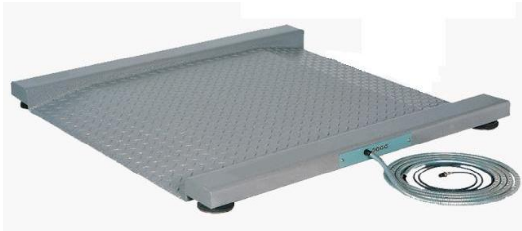
Рисунок 2 – Общий вид весов R