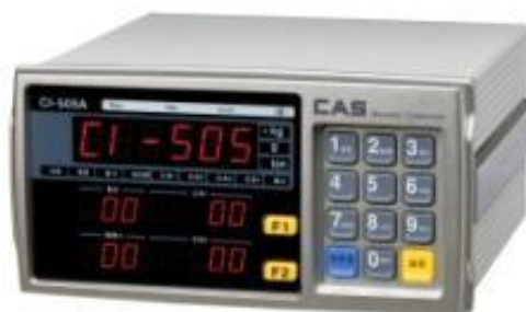
CI-503, CI-505, CI-507