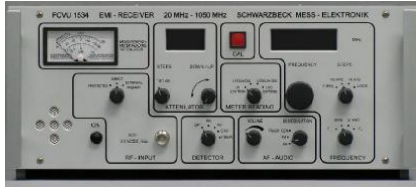
Рис. 1б Внешний вид приемника FCVU1534