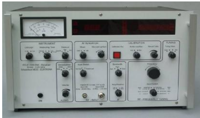
Рис. 1в Внешний вид приемника FCLE1535