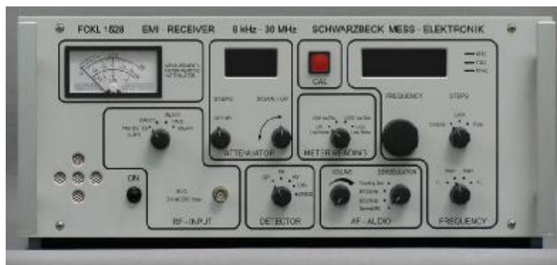
Рис. 1а Внешний вид приемника FCKL1528

Схема пломбировки от несанкционированного доступа и обозначение мест для размещения наклейки приведены на рисунке 2.