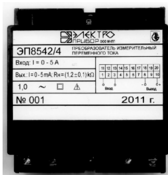
Рисунок 1 - Внешний вид преобразователя измерительного переменного тока ЭП8542.

Схема пломбировки от несанкционированного доступа и указание мест для нанесения оттиска клейма ОТК и оттиска клейма знака поверки средств измерений на ИП приведены на рисунке 2.