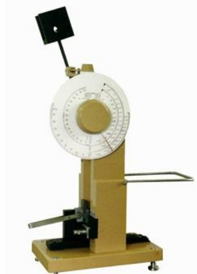
Рис 2. Копер маятниковый ТСКМ-50