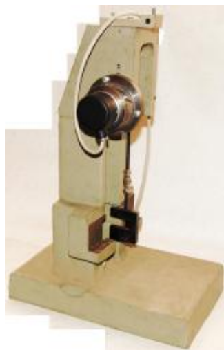
Рис 1. Копер маятниковый ТСКМ-5

Внешний вид копров маятниковых ТСКМ представлен на рисунках 1, 2 и 3.