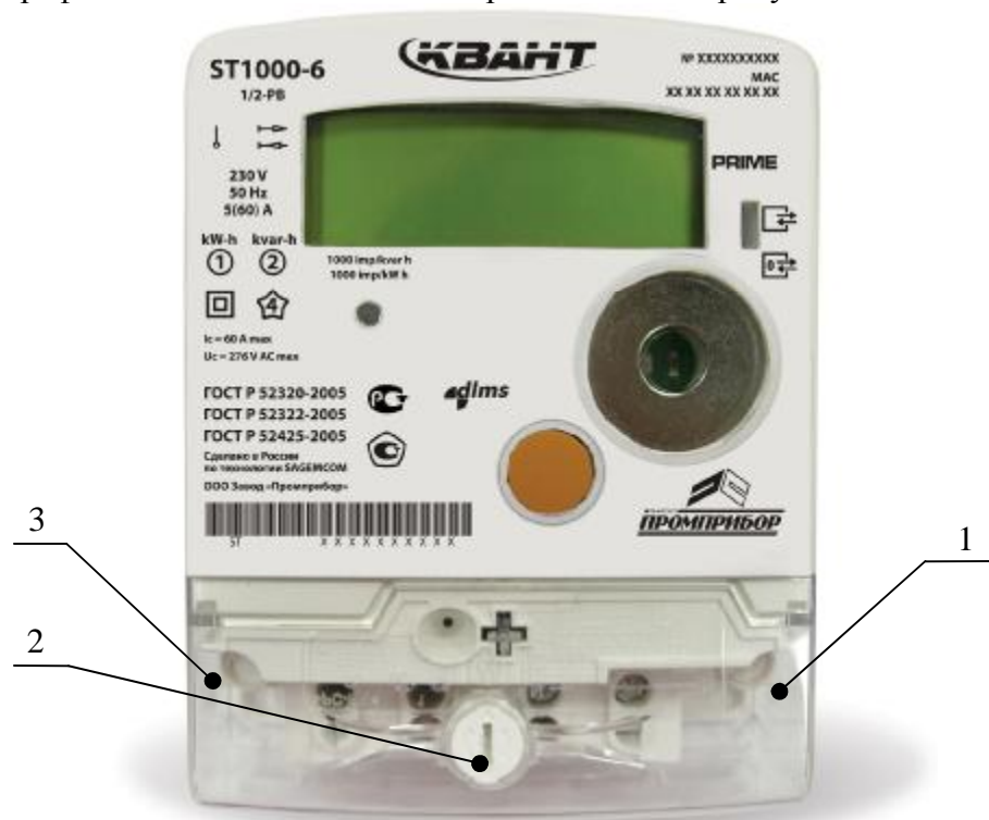
Рисунок 1 – Фотография общего вида счетчиков

Фотография общего вида счетчиков представлена на рисунке 1.