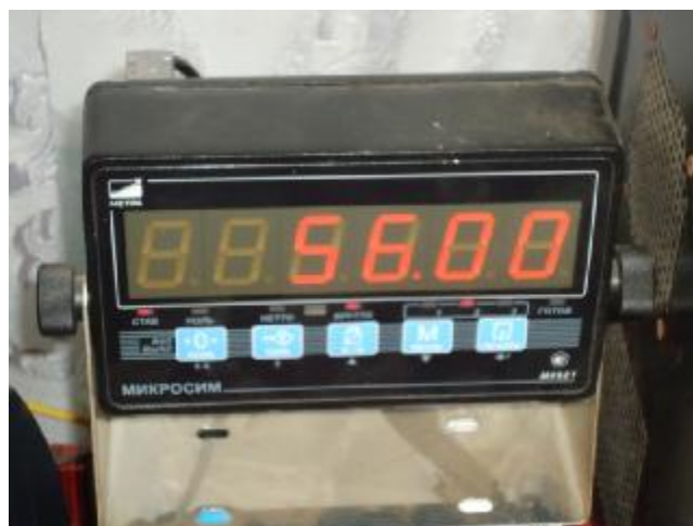
Рисунок 2 – Внешний вид прибора весоизмерительного Микросим-06

Принцип действия весов основан на преобразовании силы тяжести взвешиваемого груза посредством датчиков весоизмерительных тензорезисторных С в электрический сигнал, который обрабатывается в приборе весоизмерительном Микросим-06. Весоизмерительный прибор индицирует массу груза.