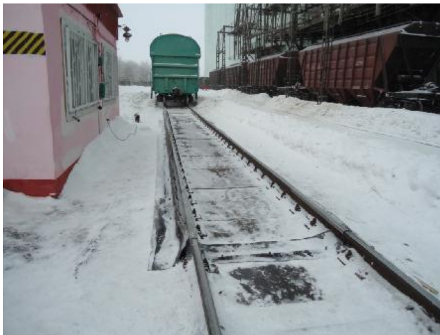
Рисунок 1 – Внешний вид грузоприемного устройства

Внешний вид грузоприемного устройства представлен на рисунке 1, весоизмерительного прибора – на рисунке 2.