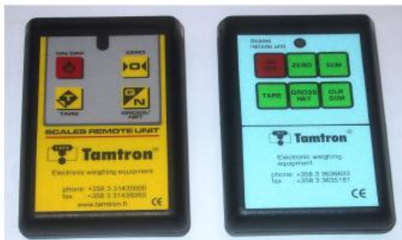
Рисунок 2 - Пульт ДУ на ИК-лучах