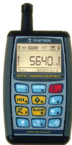
Рисунок 3 - Радиопульт ДУ DR10