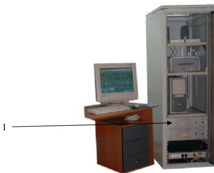
Рисунок 2 – Место нанесения знака поверки 1 – место нанесения знака поверки