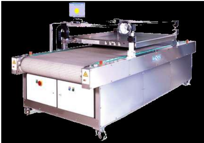
Рисунок 1 – Внешний вид установки

Внешний вид установки и схема пломбировки приведены на рисунках 1 и 2.