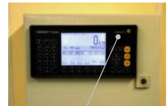
Место для нанесения знака поверки