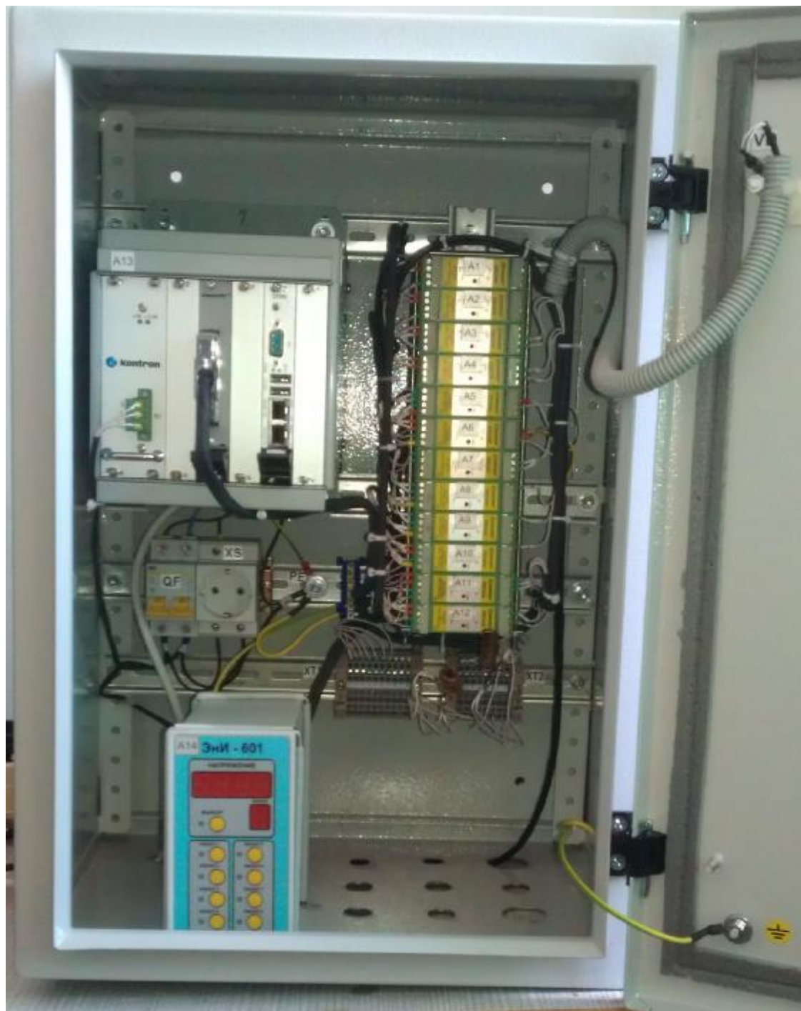
Рис. 2 – нормирующий преобразователь НП