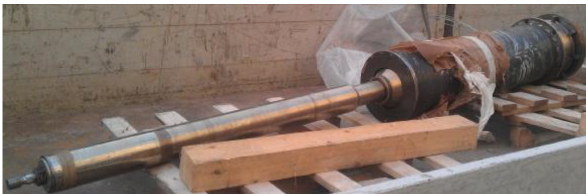
Рис. 1 – измерительная насадка РУ

Блок питания имеет 8 гальванических развязанных выходов напряжением +24 В.