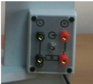
Рисунок 2 – Панель разъемов ● – место пломбирования от несанкционированного доступа.

От несанкционированного доступа установки поверочные средства измерений напряжённости магнитного поля П1-22 защищены пломбированием в соответствии с рисунками 2 и 3.