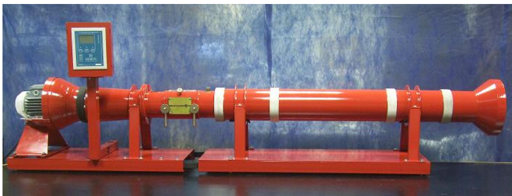
Рисунок 2 - Установка аэродинамическая А-02в