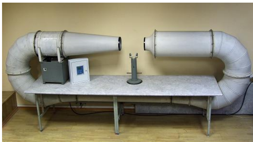
Рисунок 3 - Установка аэродинамическая А-02з