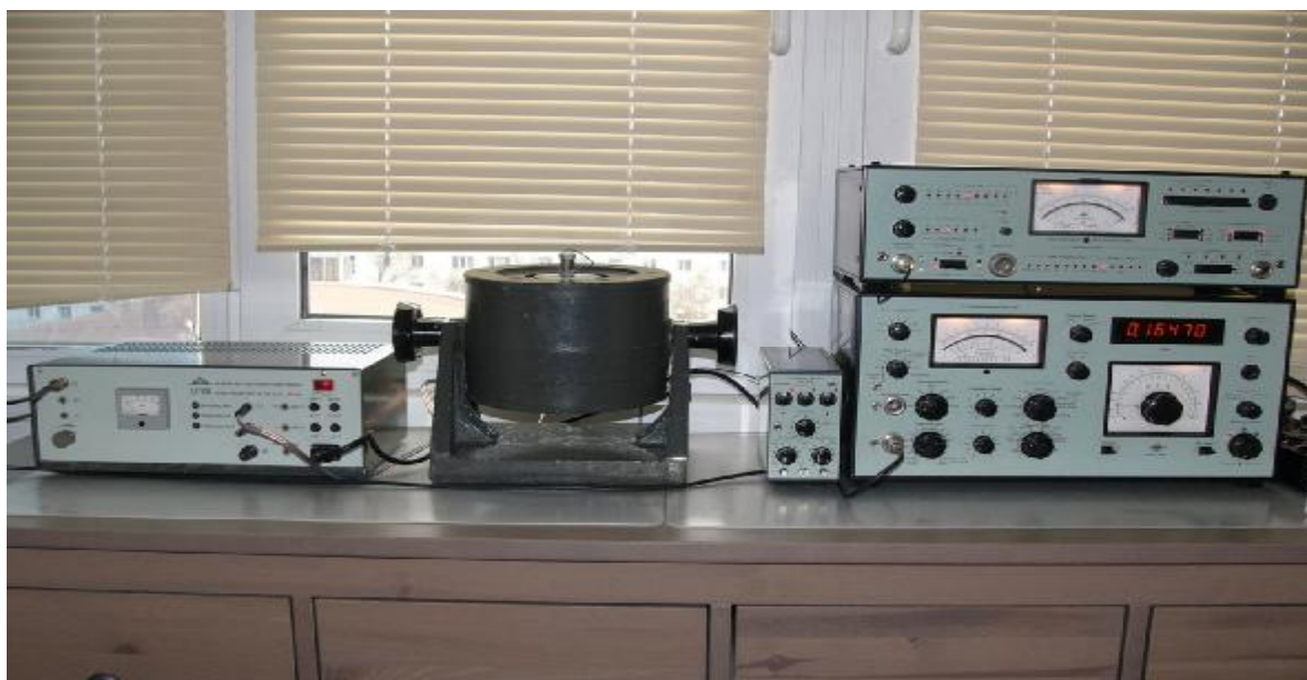
Рис. 1 Внешний вид виброустановки

Конструктивно электродинамический вибростенд состоит из корпуса с установленным в нем постоянным магнитом, форма которого позволяет создать магнитное поле в зазоре. В зазор устанавливается подвижная катушка с прикрепленным к ней вибростолом, в которой циркулирует переменный ток, поступающий с усилителя мощности. На усилитель мощности переменный сигнал подается с выхода генератора. Взаимодействие подвижной катушки, по которой проходит переменный ток, с магнитным полем приводит к появлению пондемоторных сил, вызывающих перемещение подвижной катушки и вибростолла по закону изменения переменного тока. Параметры вибрации определяются с помощью эталонного виброметра, виброизмерительный преобразователь которого установлен на вибростол.