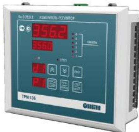
Рис.1 Общий вид приборов в корпусе «Щ4» Рис.2 Общий вид приборов в корпусе «Щ7»