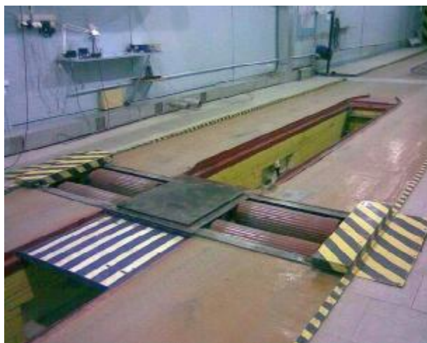
Рисунок 1 – Стенд КТС-3М