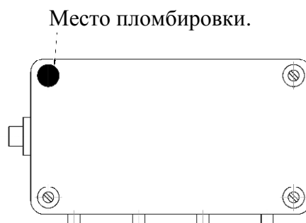
Рисунок 3 — Схема пломбировки соединительной коробки от несанкционированного доступа