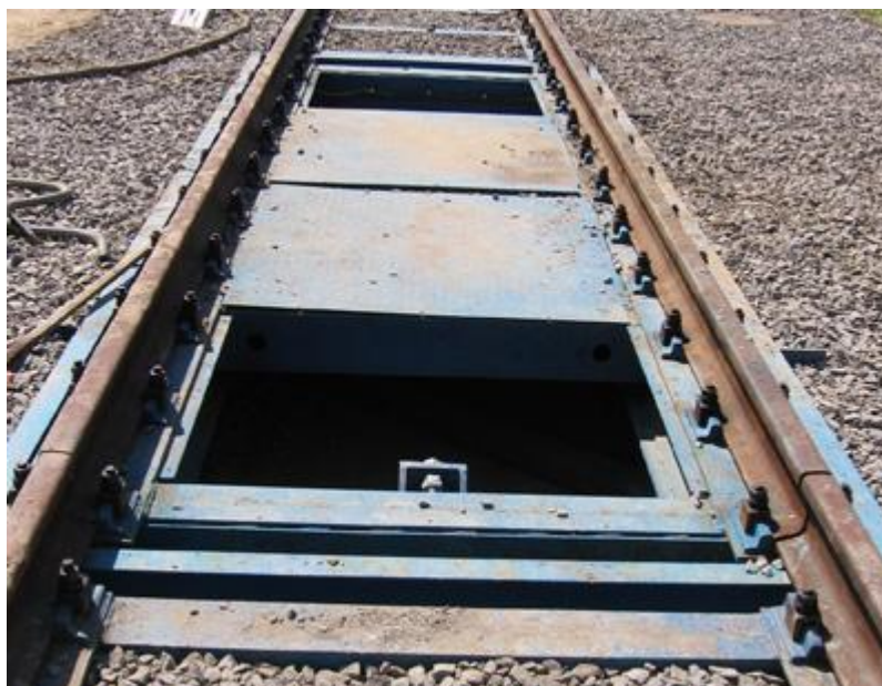
Рисунок 1 — Общий вид ГПУ весов

Весоизмерительный прибор представляет собой электронное устройство со специализированным микропроцессором. В весах используется весоизмерительный прибор модели НВТ (индикатор). В случае использования цифровых датчиков в весах используется весоизмерительные приборы DIS2116 (терминал), госреестр № 42017-09. Общий вид весоизмерительных приборов представлен на рисунке 2.