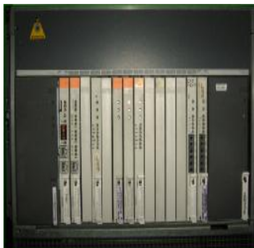
Рисунок 2- Вид с открытой крышкой защитного кожуха