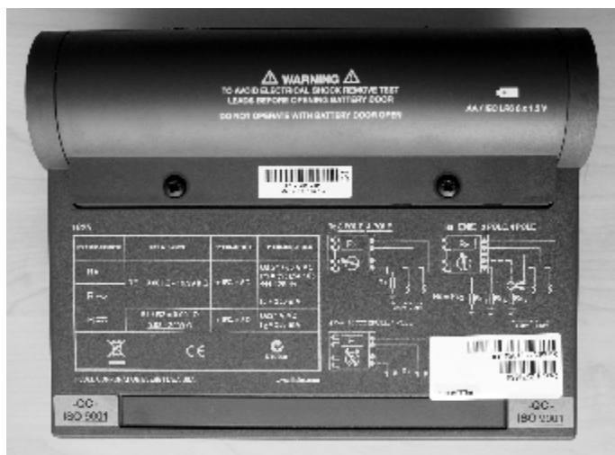
Рисунок 2 - Внешний вид тестера заземления Fluke 1625, вид снизу.