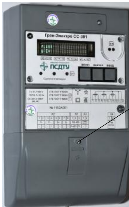
Рисунок 3 – Внешний вид счетчиков электрической энергии модификации «Гран-Электро СС-301-Х.ХХХХ(К)» и место пломбирования энергоснабжающей организации