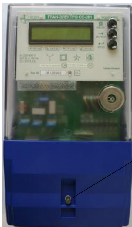
Рисунок 2 – Внешний вид счетчиков электрической энергии модификации «Гран-Электро СС-301-Х.ХХХХ» и место пломбирования энергоснабжающей организации