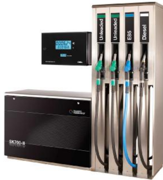
Р и с у н о к 1 – Колонка топливораздаточная SK700-2.