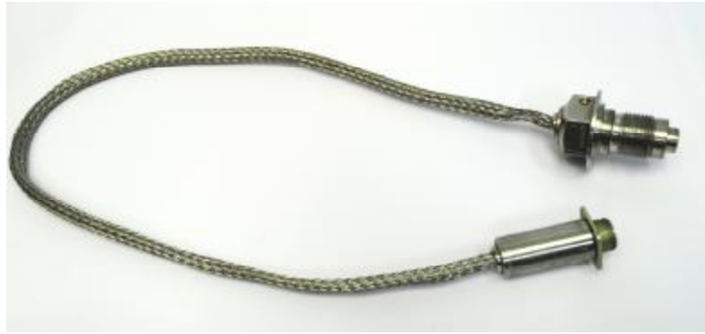
Рисунок 1 - Общий вид датчика ДДВ 011