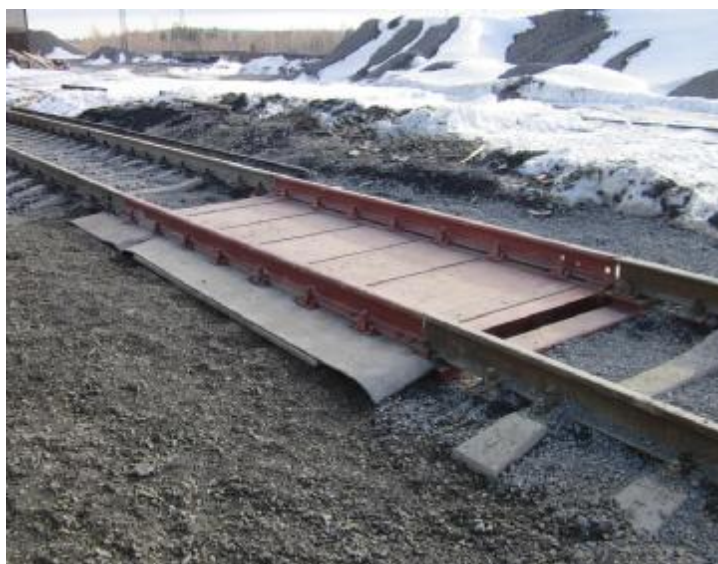
Рисунок 3 Общий вид весов вагонных ВЭД