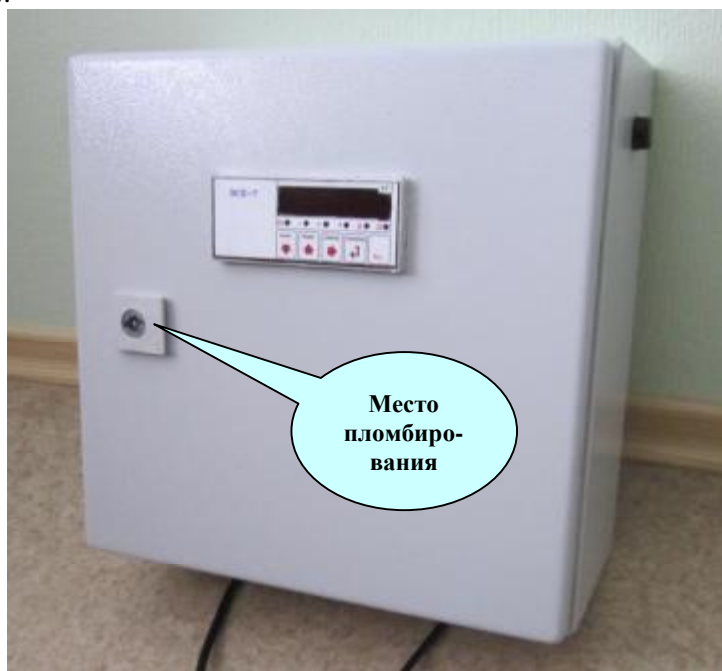
Рисунок 2 Внешний вид индикатора ВСП-7 в приборном шкафу ТНМ-55-30.30.15 и схема пломбировки от несанкционированного доступа, и обозначение места для нанесения оттиска клейма

После поверки весов корпус приборного шкафа, в котором находится индикатор ВСП-7, пломбируется поверителем пломбой, закрывающей доступ внутрь корпуса индикатора ВСП-7 (Рисунок 2).