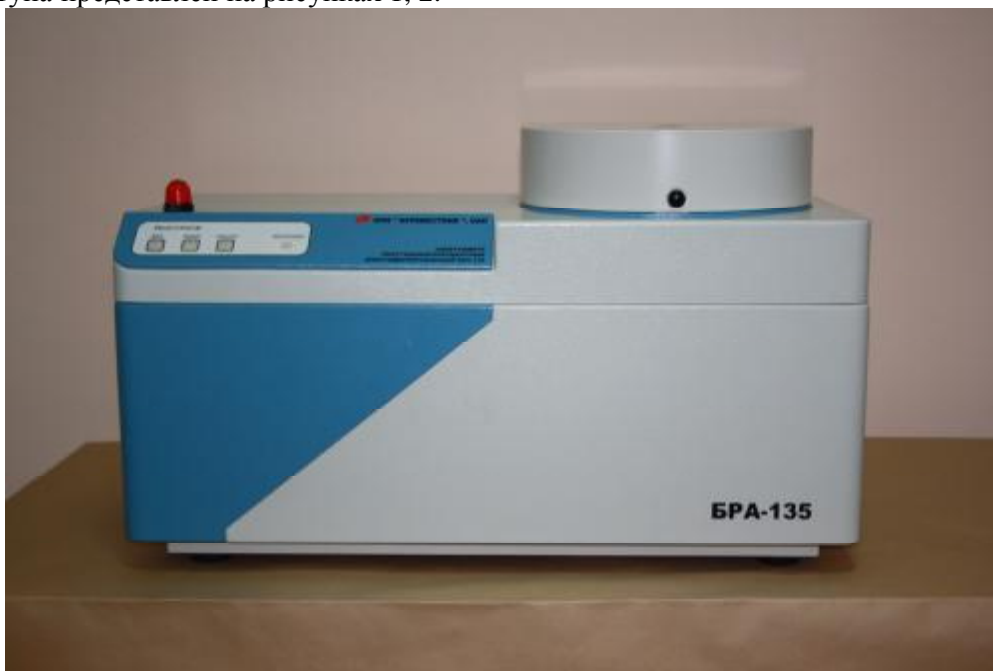
Рисунок 1 - Спектрометр рентгенофлуоресцентный энергодисперсионный БРА-135 внешний вид

Внешний вид спектрометра с указанием мест пломбировки от несанкционированного доступа представлен на рисунках 1, 2.