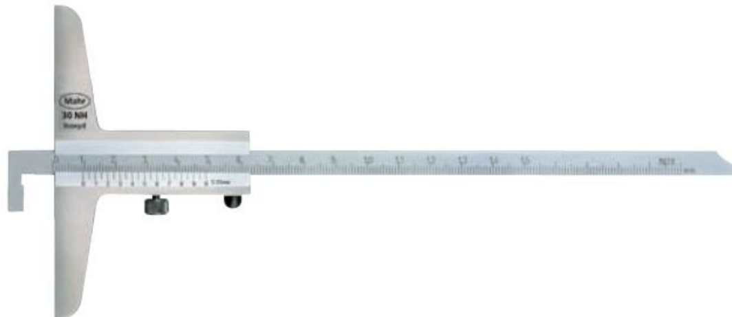
Рисунок 2 – Общий вид штангенглубиномера нониусного MarCal 30 NH