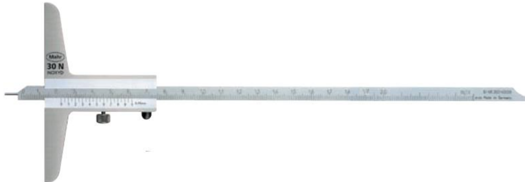
Рисунок 1 – Общий вид штангенглубиномера нониусного MarCal 30 N

Штангенглубиномер MarCal 30 ND (рис. 3) имеет специальную направляющую, которая позволяет измерять глубину и толщину уступов.