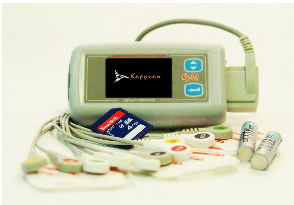
Рисунок 1 - Общий вид кардиорегистратора портативного КР-01

Общий вид кардиорегистратора портативного КР-01 представлен на рисунке 1.