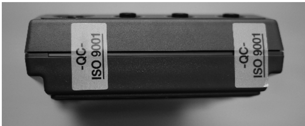
Рисунок 2 - Место пломбирования от несанкционированного доступа

Схема пломбирования тестеров от несанкционированного доступа приведена на рисунке 2.