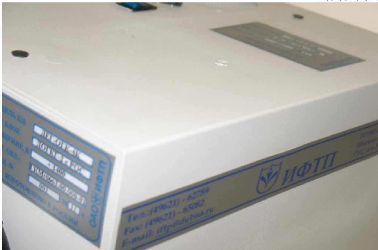
Рисунок 2 – Защита спектрометра энергий гамма-излучения полупроводникового с микрокриогенной системой охлаждения СЕГ-ГЗ-4К от несанкционированного доступа