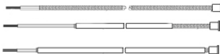
Рис.2 ТС модели S306