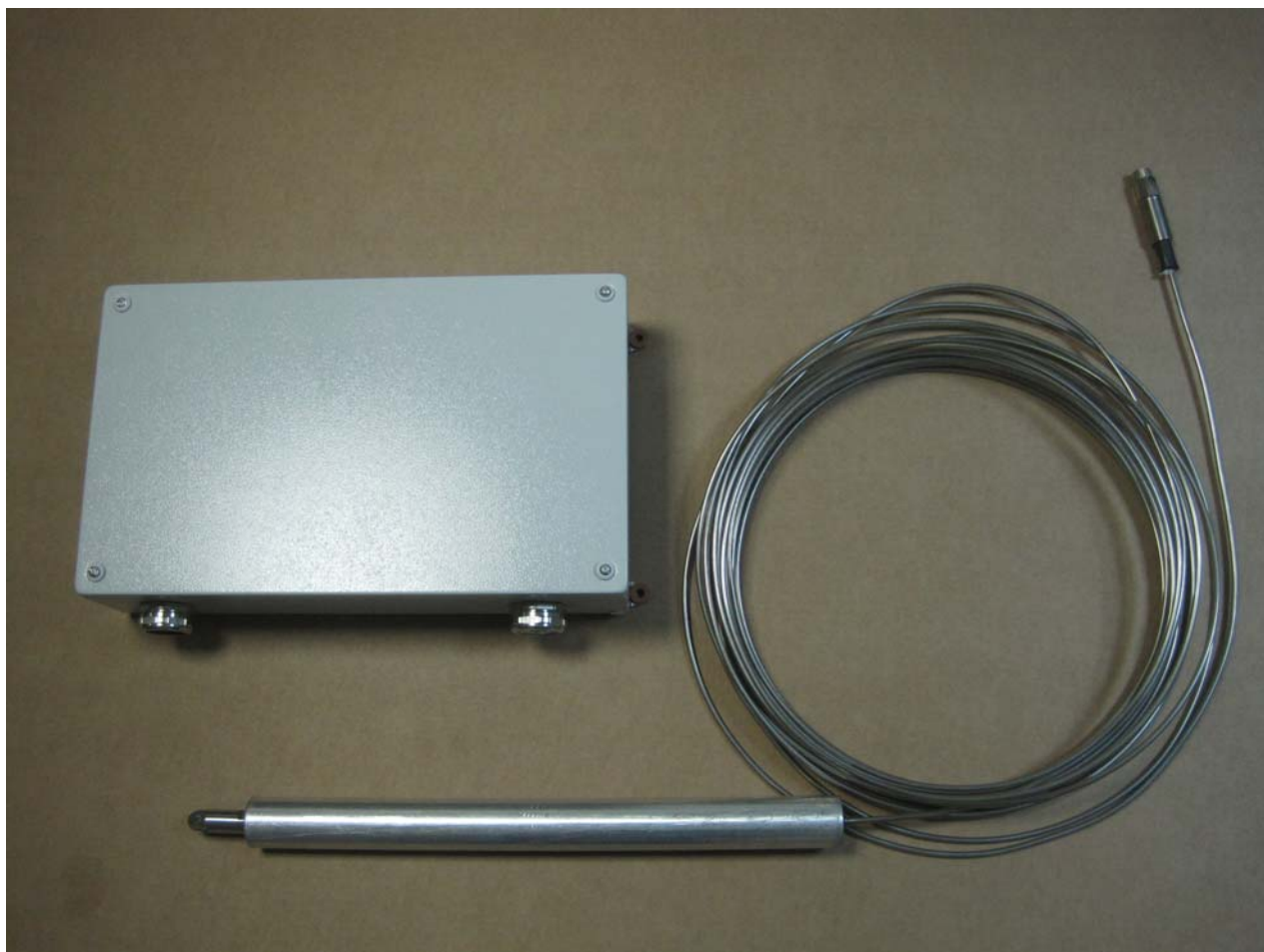
Рисунок 1 – общий вид УДПН