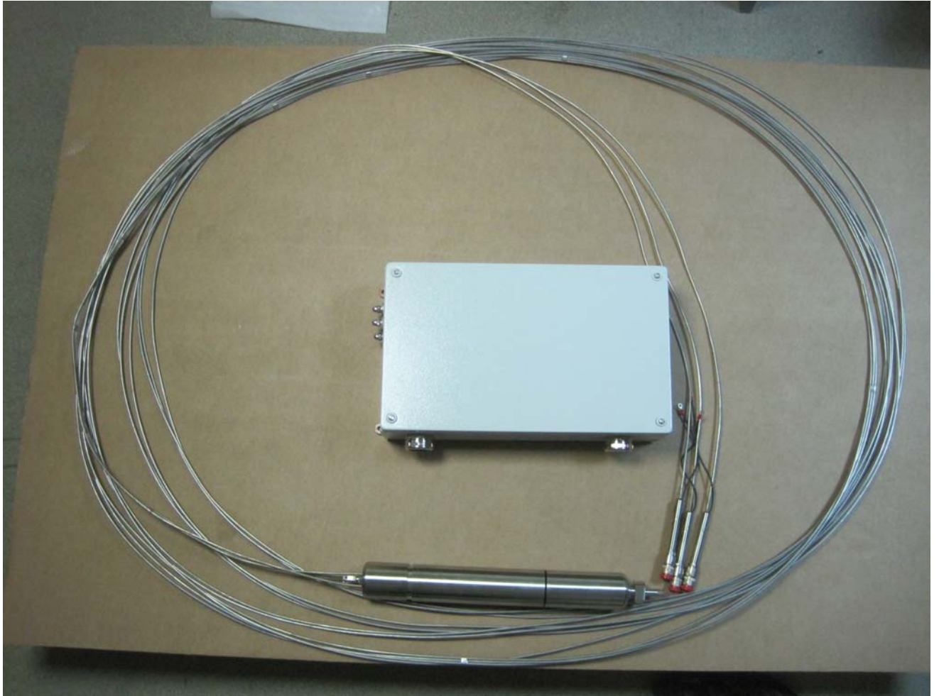
Рисунок 1 – общий вид УДПН