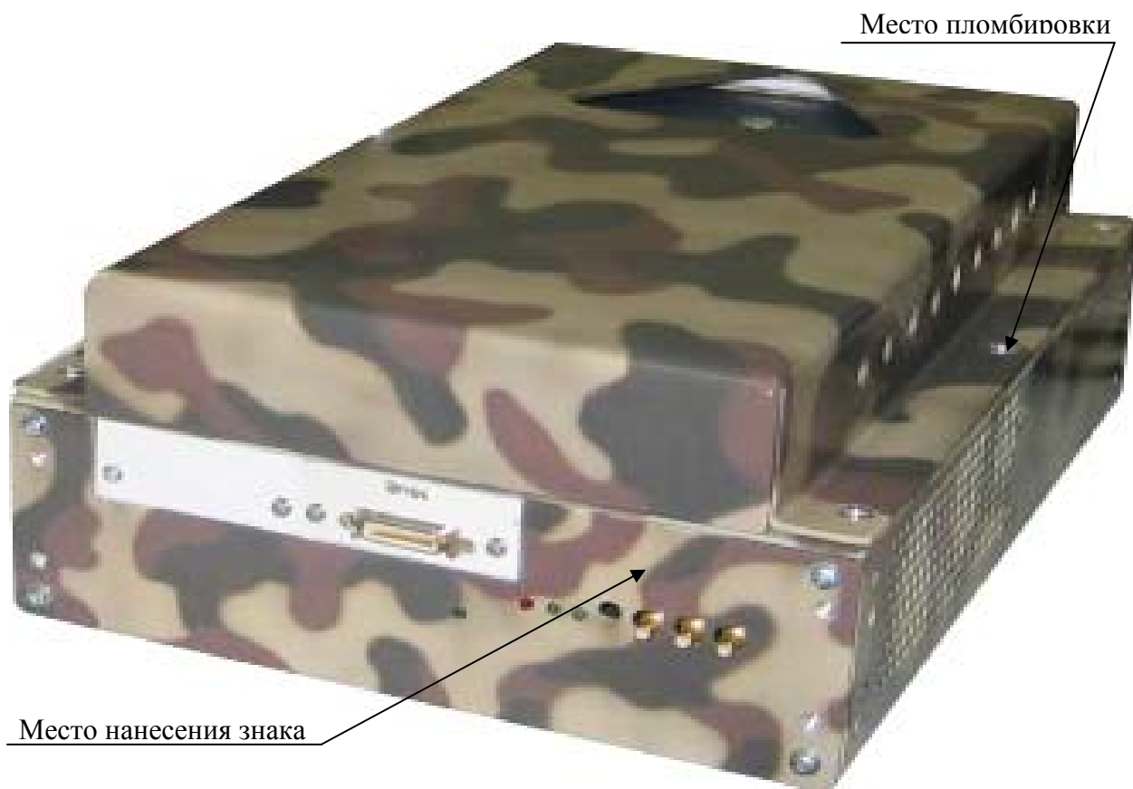
Рисунок 2 – Внешний вид устройства MezaBox\Battery 133W-hrs с установленным измерителем мгновенных значений силы тока, указанием места нанесения знака утверждения типа и местом пломбировки