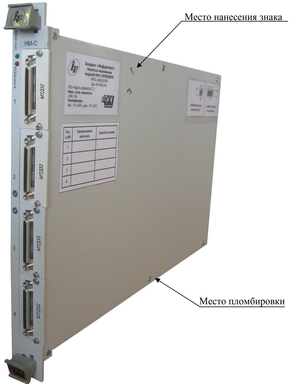
Рисунок 3 – Внешний вид носителя мезонинных модулей типа НМ (НМ-С, НМУ) с установленными измерителями мгновенных значений силы тока, указанием места нанесения знака утверждения типа и местом пломбировки