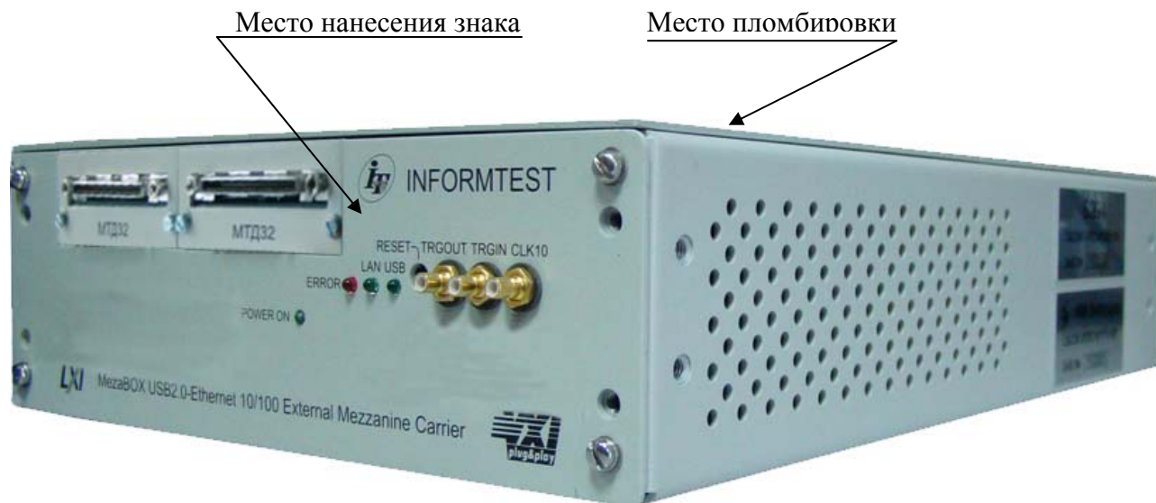
Рисунок 1 – Внешний вид устройства MezaBox с установленными измерителями мгновенных значений силы тока, указанием места нанесения знака утверждения типа и местом пломбировки