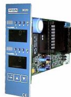
б) 9020 LCD – в виде платы для установки в шасси