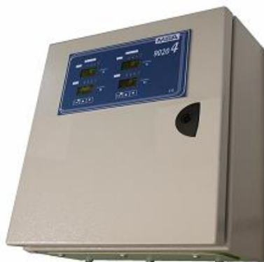
д) 9020-4 LCD Wall Mount – для настенного монтажа