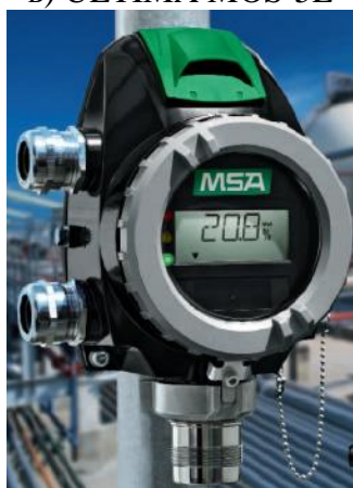
д) PrimaX I