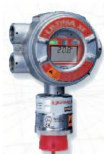
б) Ultima XE