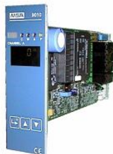
а) 9010 LCD – в виде платы для установки в шасси