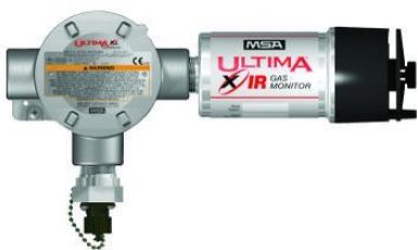
а) Ultima XIR