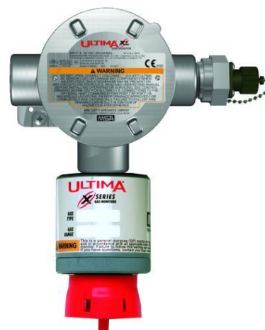
е) ULTIMA XL