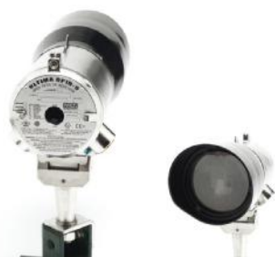
ж) ULTIMA OPIR-5