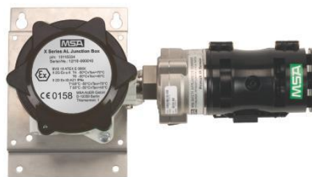
з) PrimaX IR