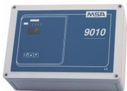
в) 9010 LCD Wall Mount – для настенного монтажа