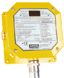
в) ULTIMA MOS-5E