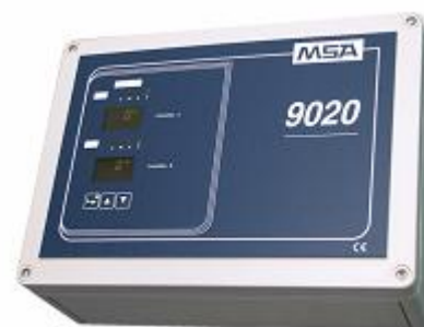
г) 9020 LCD Wall Mount – для настенного монтажа