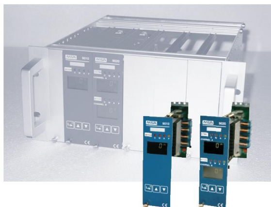
ж) шасси для 10 плат