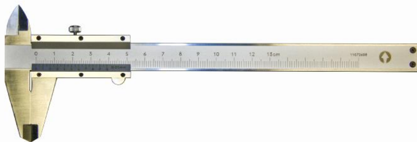
Рисунок 1 – Общий вид штангенциркулей типа ШЦ-I Diapazon.

Штангенциркули ШЦ-II состоят из штанги, рамки, стопорного винта, губок с кромочными измерительными поверхностями для измерений наружных размеров (для ШЦ-II) или без них (ШЦ-III), губок с плоскими и цилиндрическими измерительными поверхностями для измерений наружных и внутренних размеров соответственно, устройства тонкой регулировки рамки.