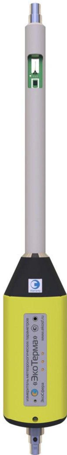
Рисунок 1. Внешний вид измерителей «ЭкоТерма».

Допускается подключение нескольких измерителей к единому моноканалу, в том числе радиоканалу, что позволяет организовывать на их базе измерительные сети.