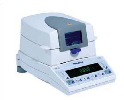
Рисунок 1 - Общий вид весов-влажмеров ХМ 50

Конструктивно весы-влажмеры выполнены в едином корпусе и состоят из встроенных аналитических весов, нагревательного элемента (галогенного, инфракрасного или темнового), расположенного в крышке весов-влажмеров, блока управления и показывающего устройства, выполненного в виде вакуумно-люминесцентного дисплея. Передняя панель весов-влажмеров оснащена кнопками управления. На корпусе весов-влажмеров расположено устройство установки по уровню. Общий вид весов-влажмеров представлен на рисунке 1.