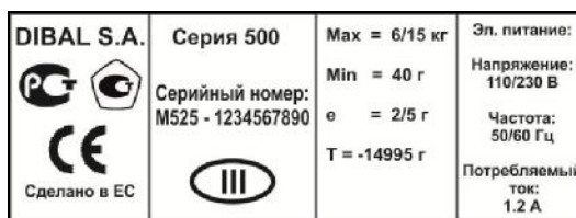
Рисунок 4 –Маркировка весов

Маркировка весов производится на фирменной наклейке (Рис. 4),