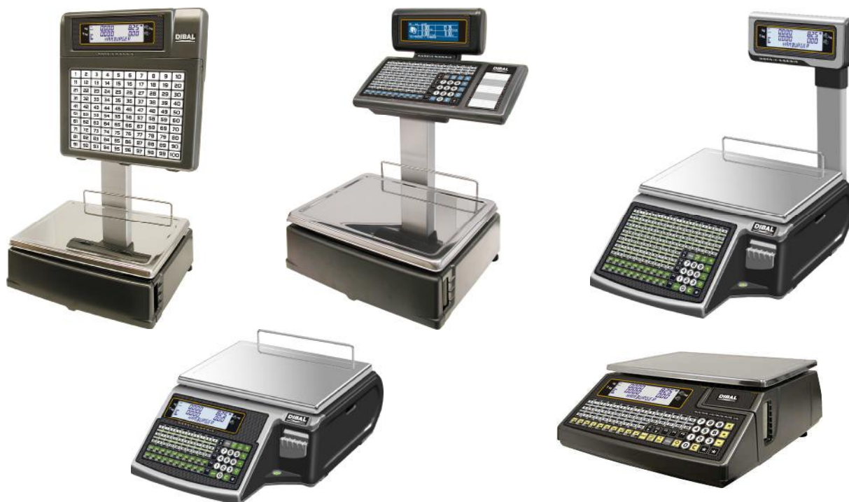
Рисунок 3 – Общий вид весов