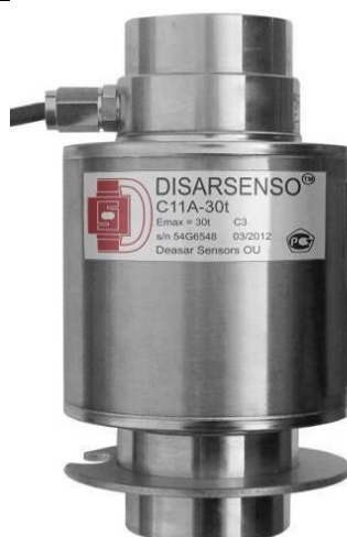
Рис. 1 Общий вид датчика С11