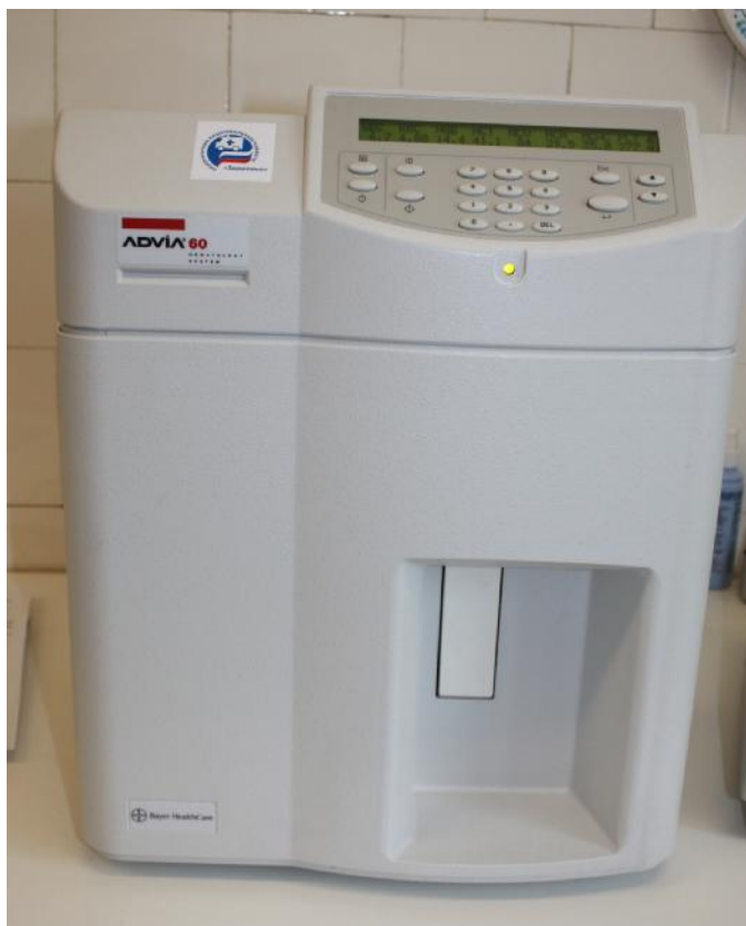
Рисунок 1 – Общий вид системы Advia 60