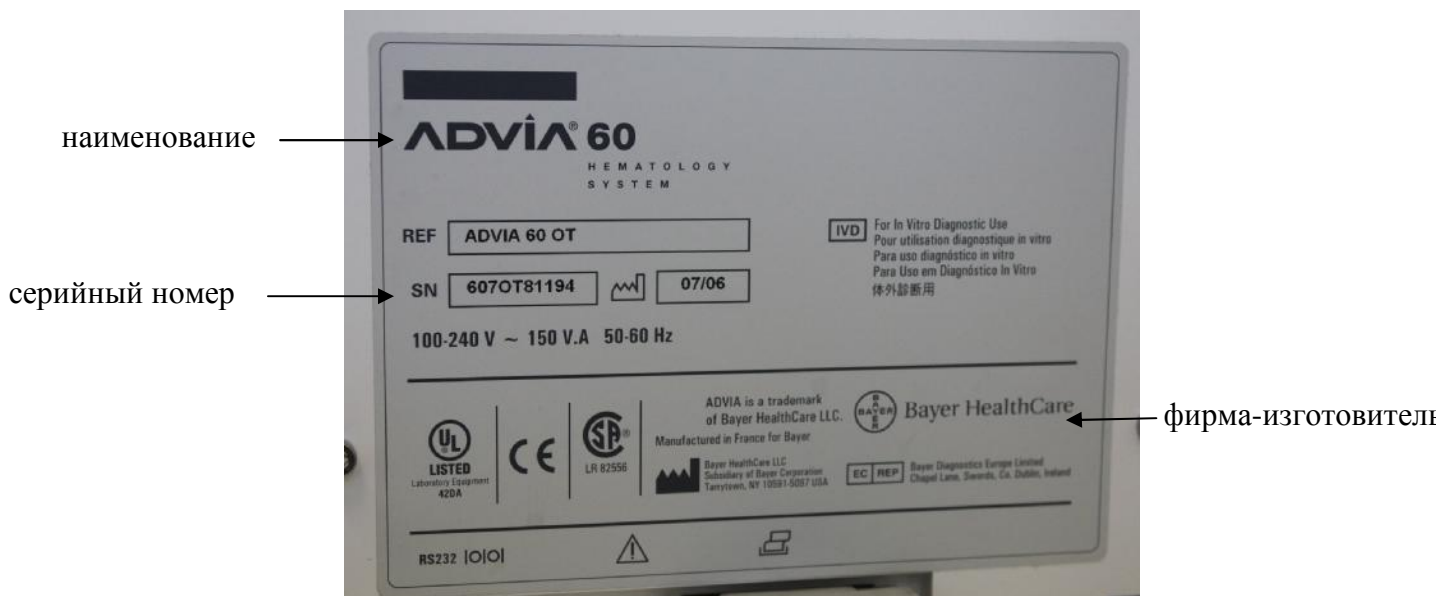
Рисунок 2 – Схема маркировки