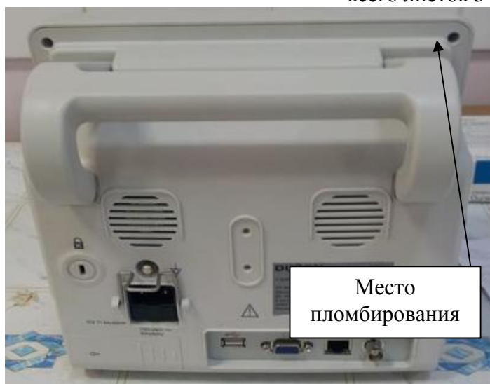
Рисунок 2. Монитор пациента Сторм-5500. Вид сзади.