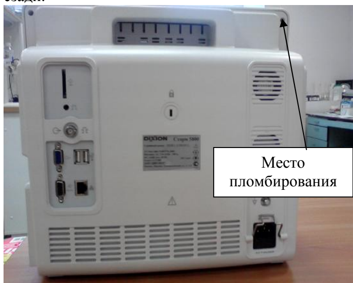
Рисунок 4. Монитор пациента Сторм-5800. Вид сзади.