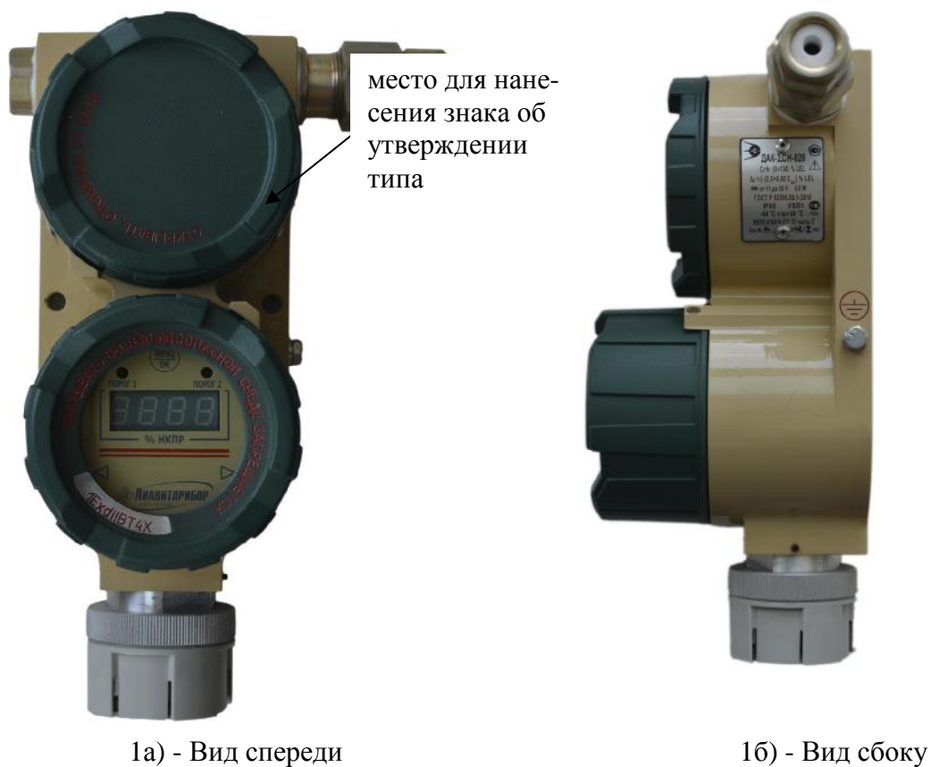
Рисунок 1– Общий вид газоанализаторов