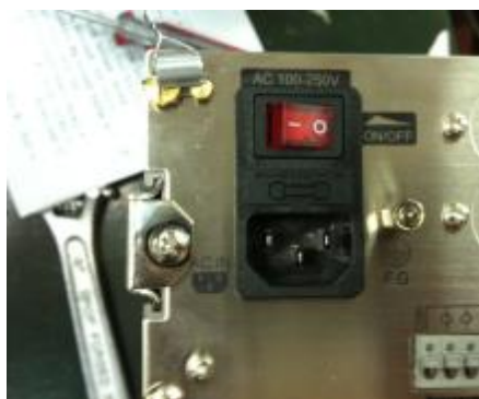
CI-501, CI-502, CI-503, CI-505, CI-507