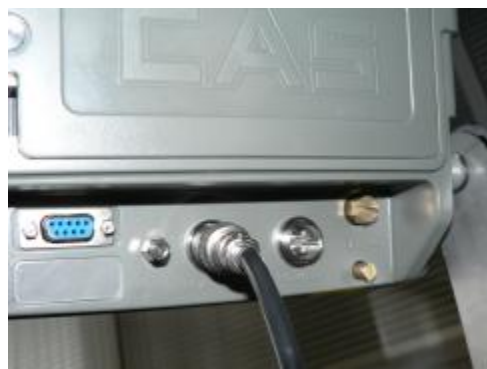
CI-200A, CI-200S/SC, CI-201A, CI-201S/SC