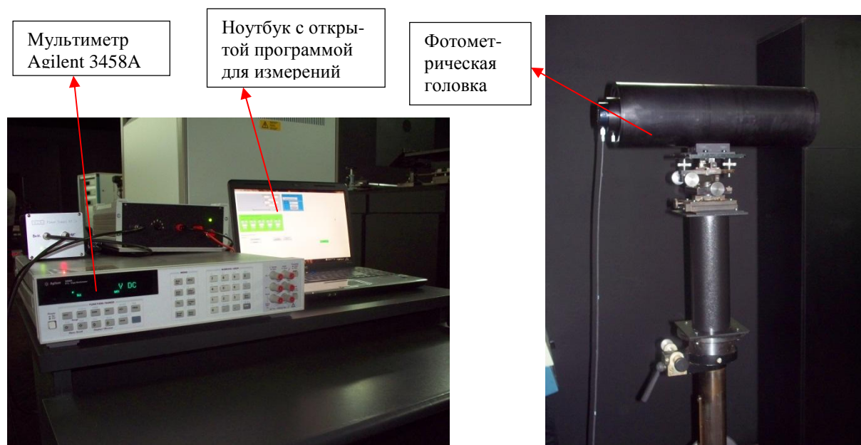
Рисунок 3 - Фотометрическая головка в тубусе и измеритель