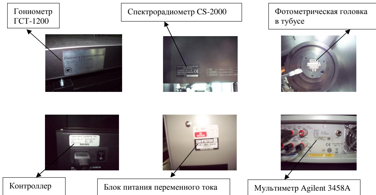
Рисунок 4 - Маркировка