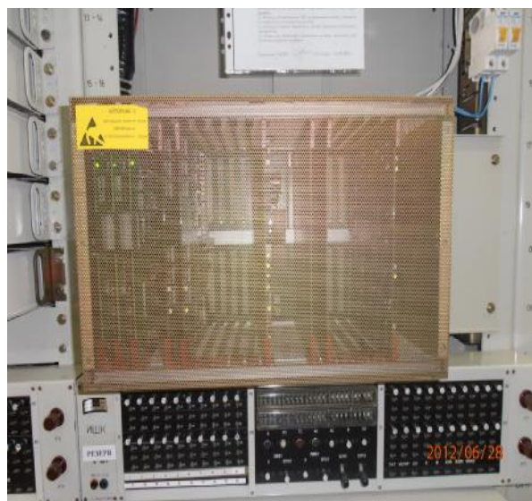
Рисунок 1 Общий вид оборудования Корпус блокируется защитной разрушаемой наклейкой

Микросхема ПЗУ M27C512 на плате абонентских регистров, защищена от съема с места установки с помощью кодированной информации. При замене ПЗУ происходит кратковременный сбой в работе соответствующего блока и запускается аварийная сигнализация АТС.