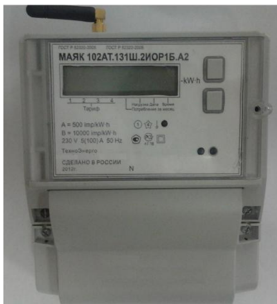
Рисунок 1 – Внешний вид счетчика с закрытой клеммной крышкой

Внешний вид счетчика МАЯК 102АТ с закрытой клеммной крышкой приведен на рисунке 1.