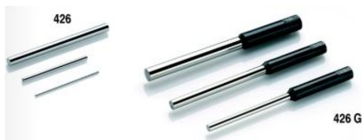
Рисунок 1 - Общий вид мер установочных MarGage 426 и MarGage 426 G.

Меры MarGage 426 D, MarGage 426 DS используются также как калибр-пробки для контроля отверстий малых диаметров.