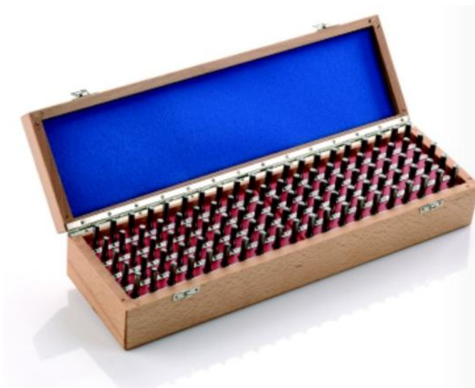
Рисунок 2 - Общий вид набора мер установочных MarGage 426 S.