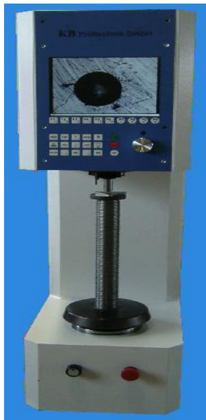
Рисунок 1 - Внешний вид твердомеров КВ 3000, КВ 1000, КВ 750, КВ 250.