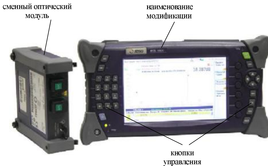
б) модификация MTS-4000