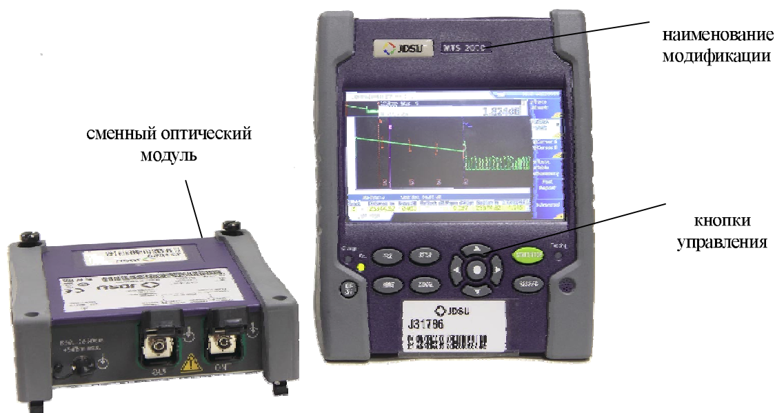
а) модификация MTS-2000

Конструктивно система выполнена в пластмассовом корпусе в виде переносного прибора. На лицевой панели системы расположены кнопки управления и цветной сенсорный дисплей. Сменные оптические модули крепятся к задней панели базового блока при помощи винтов. Модификация MTS-2000 содержит 1 модуль и более компактна по сравнению с двухмодульной MTS-4000 при одинаковом объеме сервисных опций.