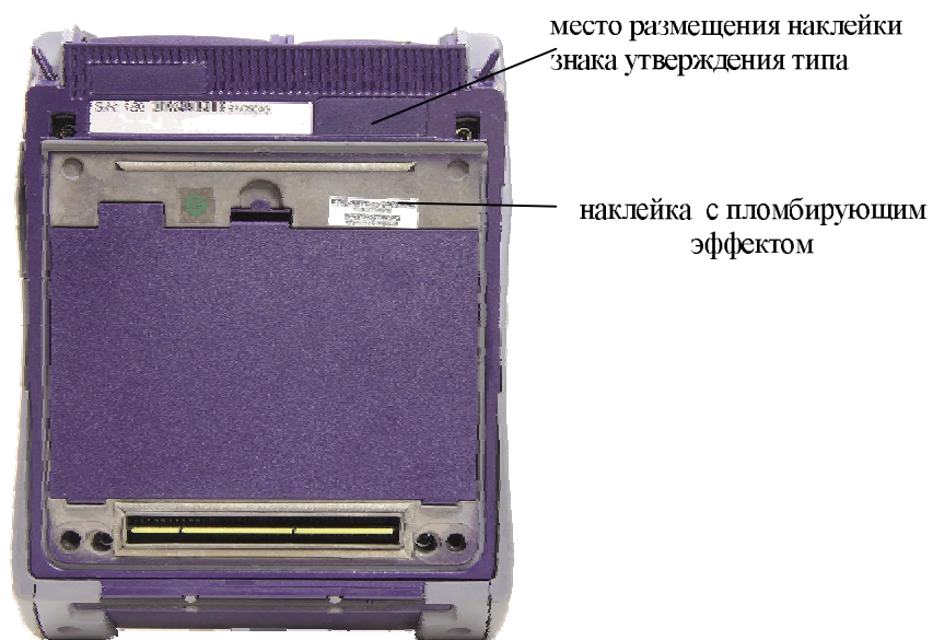
а) модификация MTS-2000