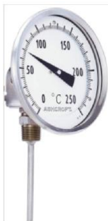
Рис.1 - Термометры серии ЕЛ

Фотографии общего вида термометров приведены на рисунках 1-2.