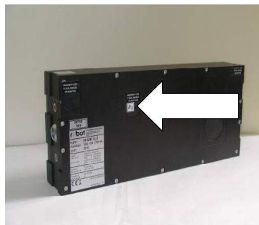
Базовый блок - на корпусе центрального процессора