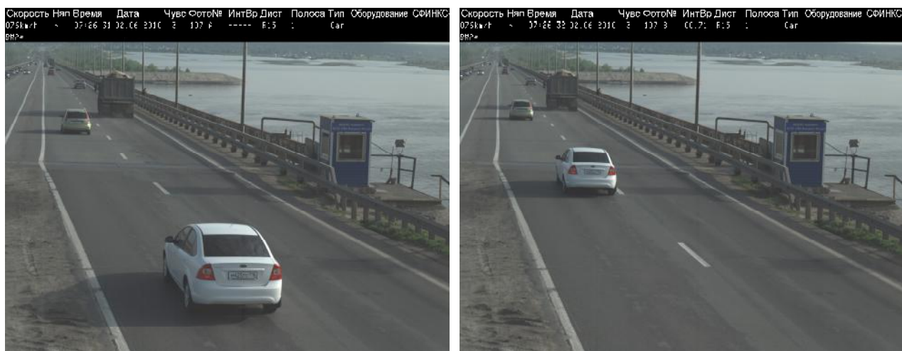
Рисунок 1 - Результат измерений скорости транспортного средства и расположения его на проезжей части.