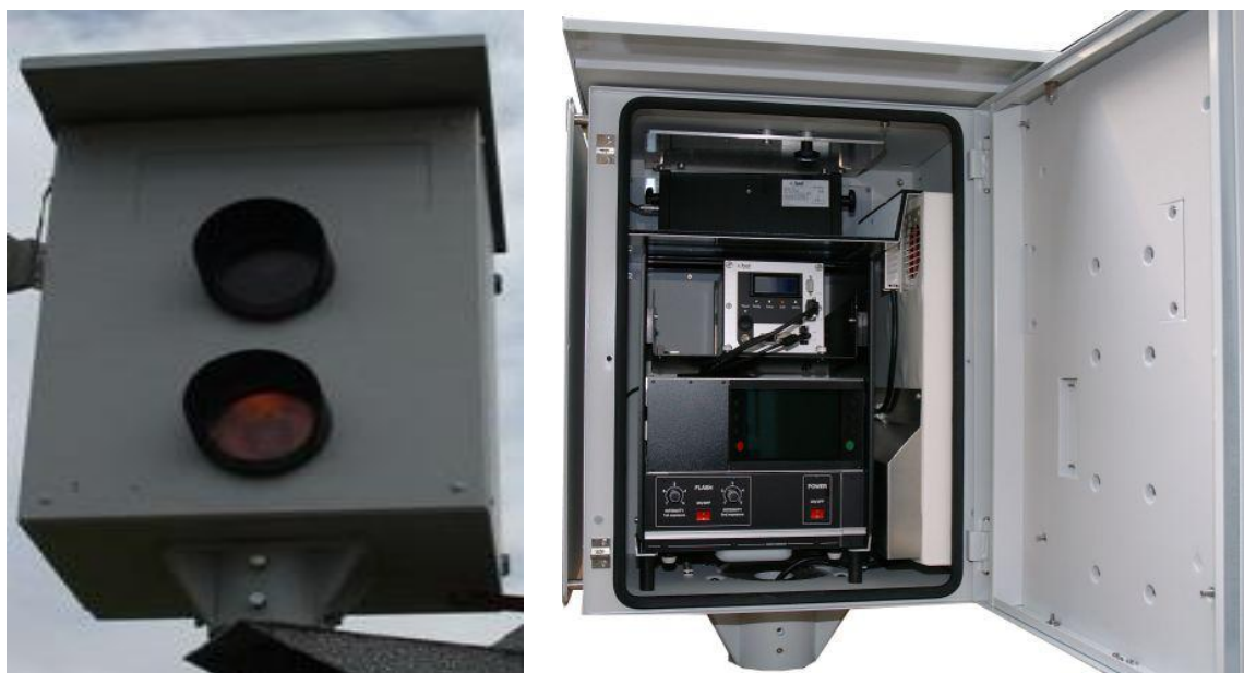
Рисунок 2 - Внешний вид измерителя скорости